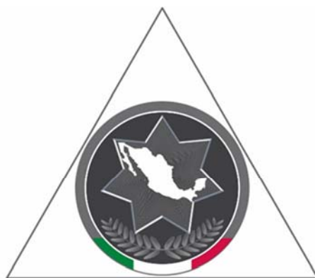
Conferencia Nacional de Secretarios de Seguridad Pública