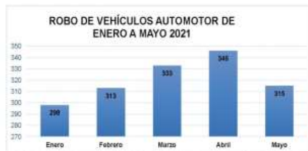
Gráfica 3. Elaborada con base en la "Incidencia Delictiva del Fuero Común" reportada por el Secretariado Ejecutivo del Sistema Nacional de Seguridad Pública.

En ese sentido, en el periodo de enero a mayo de 2021, el mes de abril se reporta con el más alto índice de reporte por robo de vehículos con 346 denuncias, seguido del mes de marzo que reportó 333 vehículos robados, como a continuación se muestra: